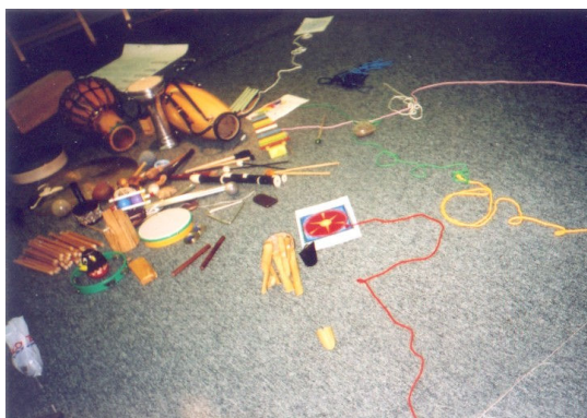
Ivanka pri Dunaji – Muzikoterapeutické kurzy