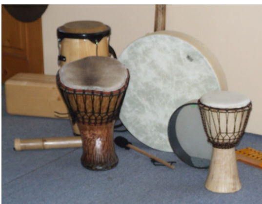
foto © Martina Krušinská, 2007 Žilina – Muzikoterapeutické a etnopedagogické moduly pre pedagógov